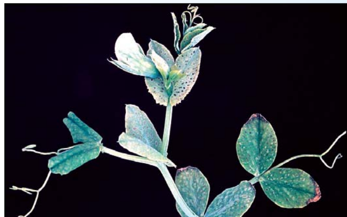
Nedostatok mangánu (hrach)