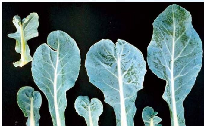
Nedostatok molybdénu (karfiol)