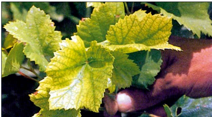
Nedostatok železa a zinku (vinič)