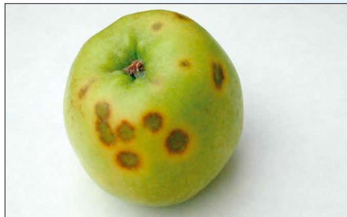
Jabloň (príznaky na plodoch)