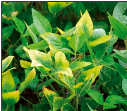
Nedostatok draslíka (sója)