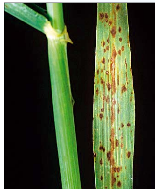
Nedostatok mangánu (jačmeň)