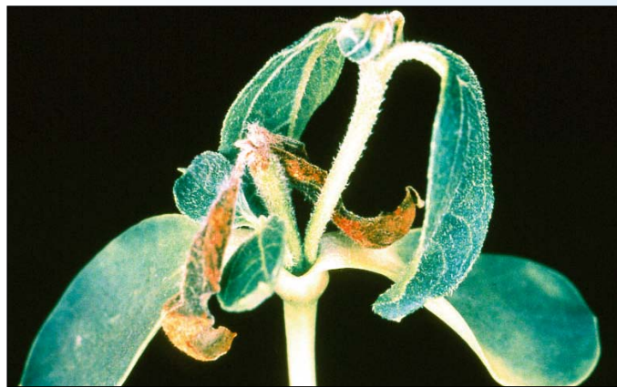
Nedostatok bóru (slničnica)