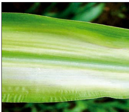
Nedostatok zinku (kukurica)