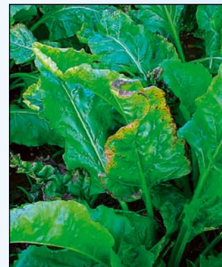
Nedostatok draslíka (cukrová repa)