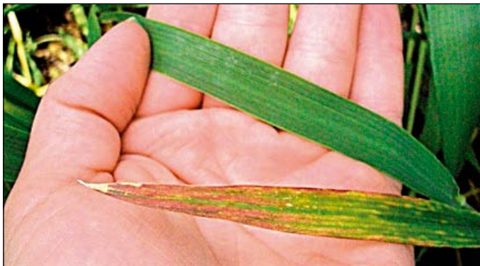
Nedostatok fosforu (pšenica)