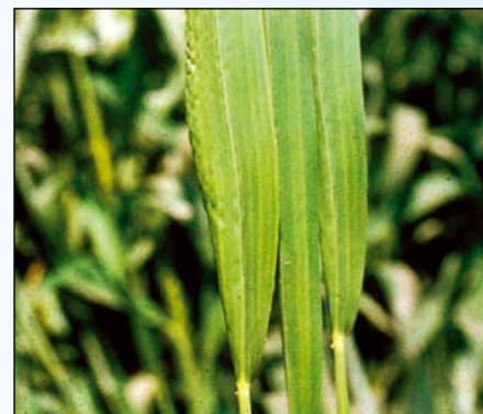
Nedostatok mangánu (pšenica)