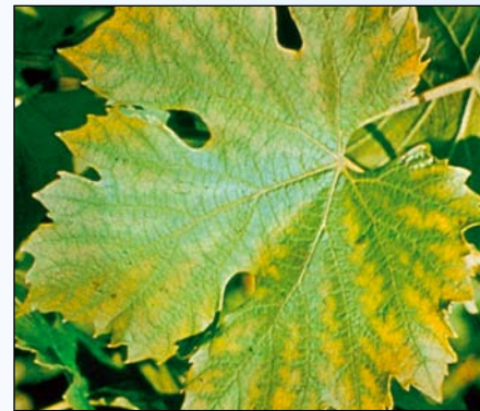
Nedostatok mangánu (vinič)