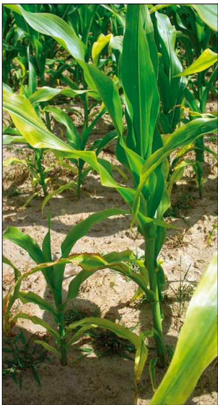
Nedostatok draslíka (kukurica)