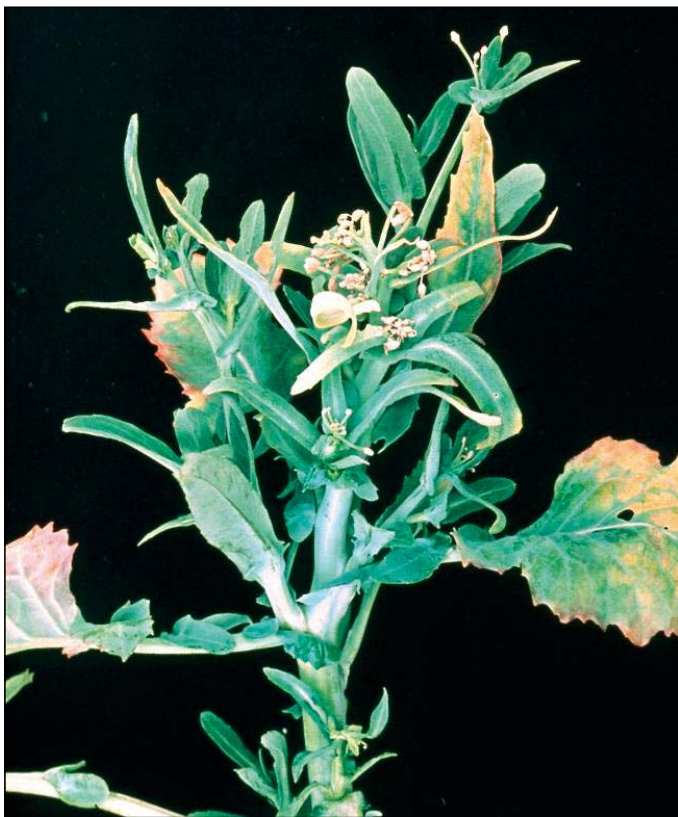
Nedostatok bóru (reпка)